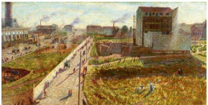
In copertina: Umberto Boccioni (Reggio Calabria 1882 - Verona 1916) Officine a Porta Romana , 1910 olio su tela 75 x 145 cm. Collezione Intesa Sanpaolo Gallerie d'Italia-Piazza Scala, Milano

A Napoli, le Gallerie di Palazzo Zevallos Stigliano presentano il Martirio di sant'Orsola , opera dell'ultima stagione del Caravaggio, insieme a vedute sette-ottocentesche del territorio campano.